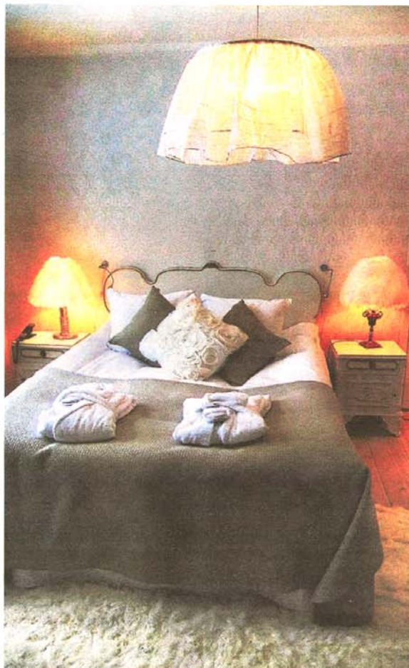
Rummen är mysiga, personligt inredda och väl utrustade. Nackdelen är att gästerna måste lämna slottet för att komma till sitt rum.

Betyg 1: Grand Hotel Saltsjöbaden, Nacka. (27 dec -09). Klassiskt hotell som är mycket dåligt underhållet.