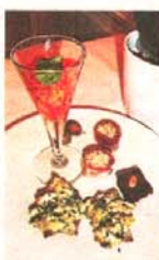
Mat och dryck håller högsta klass.